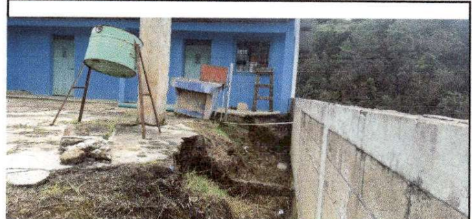
Foto 8: En el área de la cocina una buena parte del patio fue inundado por un fenómeno natural desde el año 2015 y no se ha reparado situación que atenta contra la integridad física los niños y las niñas de la escuela.