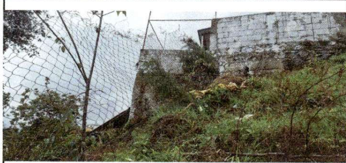
Foto 7: Muro perimetral deteriorado y en mal estado, situación que expone la integridad física de los niños y las niñas y el resguardo de los bienes del centro educativo