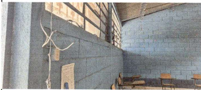
Foto 9: La instalación eléctrica en las aulas se encuentra en mal estado, necesita mantenimiento.